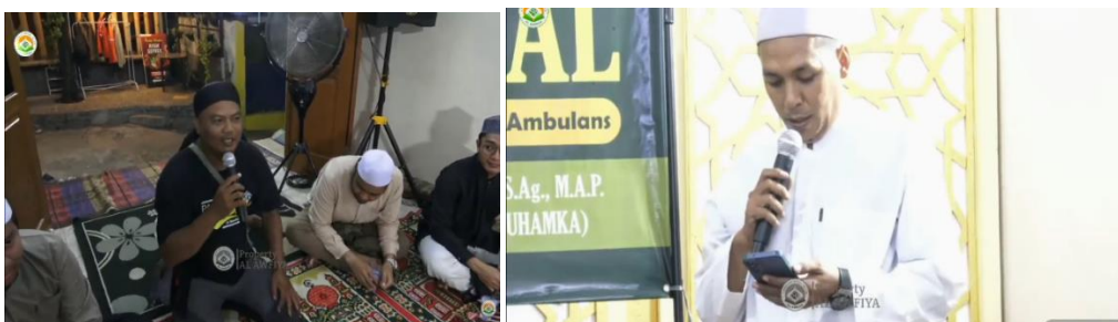
Gambar 4. Sesi Diskusi dan Tanya Jawab

Para relawan ambulans di PT. Zen Ambulans Indonesia umumnya terdiri dari sopir ambulans, admin pemesanan ambulans serta perawat umumnya berlatarbelakang pendidikan umum yang masih kurang memahami materi pendidikan agama Islam seperti dalil naqli, fikih ibadah serta muamalah. Materi dimensi sosial dalam ibadah tidak hanya menyajikan akhlak bagi para relawan ambulans akan tetapi juga memfasilitasi permasalahan fikih yang dihadapi para relawan seperti qasar jamak saat dalam perjalanan, dan materi ini meliputi fikih zahir (hukum Islam) dan fikih batin (akhlak). Sehingga terjadi perubahan pemahaman keagamaan para relawan ambulans di PT. Zen Ambulans Indonesia setelah mengikuti penguatan akhlak sosial ini. Relawan ambulans yang menggeluti kegiatan sosial yang merupakan bagian dari khidmah, melalui pengalaman khidmah, para relawan mengalami proses internalisasi nilai-nilai Islami seperti kepedulian sosial, kerendahan hati, keikhlasan, dan cinta terhadap sesama. Nilai-nilai ini yang membentuk kesalehan individu dan sosial yang memperkuat kesadaran kolektif. 8